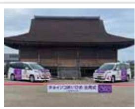
令和4年10月3日 「チョイソコめいひめ」出発式 (広報めいわ令和4年11月号)