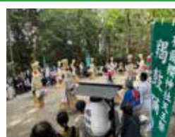
R4.10.16(日) 有爾中天王踊 (かんこ踊り)