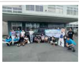
令和4年8月29日 「mobi」お披露目会 &ワークショップ