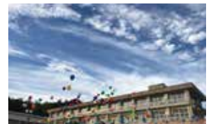
広報めいわ令和5年1月号より

修正小学校にて「閉校記念式典・行事・イベント」が開催され、在校生や保護者、多くの卒業生の方々などが参加されました。創立112年の修正小は、少子化等による児童減少などにより令和5年3月に閉校となり、今後、児童は明星小と齋宮小に通うこととなります。