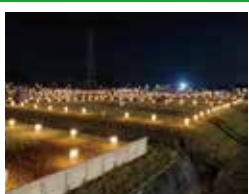
R4.9.10(土) ろうそくと竹灯りの イベント