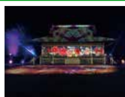
R4.11.3(木)～5(土) 国史跡齋宮跡平安絵巻 プロジェクションマッピング