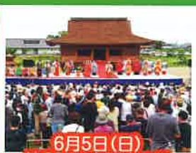
6月5日(日) 第39回 斎王まつり

町ではコロナ禍により影響を受けた農水産業を支援するため、「稲作農家応援支援金事業」、「水産業燃料支援金事業」、「黒海苔養殖応援支援金事業」を行います。