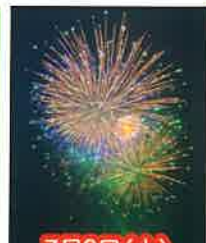
7月9日(土) 上村天王祭