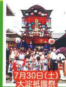
7月30日(土) 大淀祇園祭